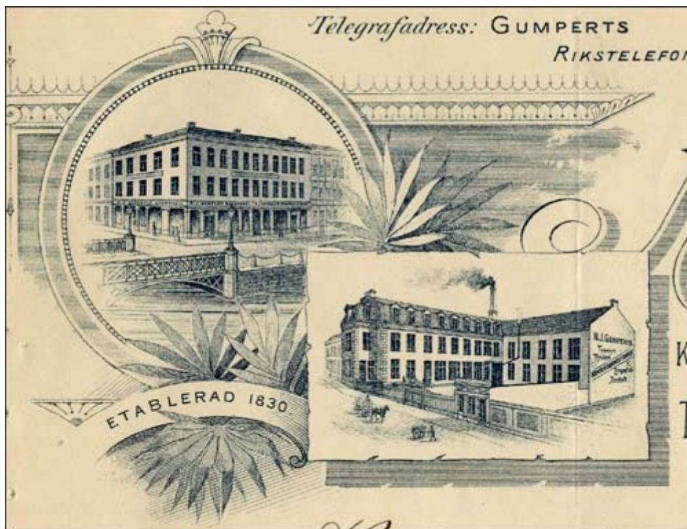
Gumperts bokhandel och fabrik 1897