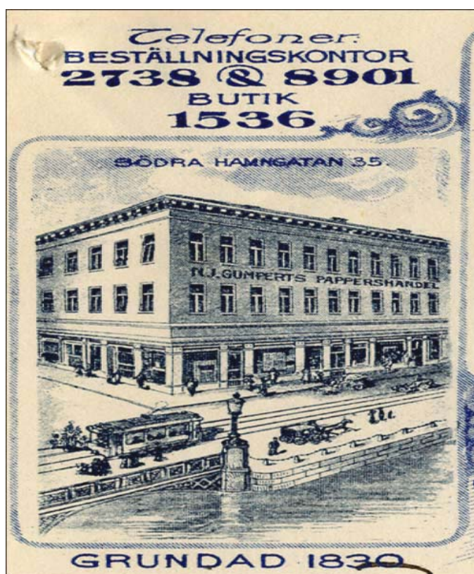
Gumperts bokhandel 1914