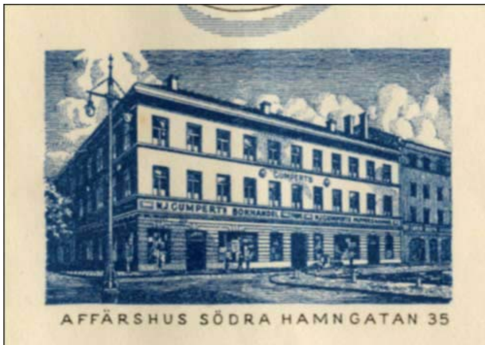
Gumperts bokhandel och fabrik 1936

Gumperts hörna var ett begrepp i Göteborg, så länge bokhandeln låg i sydvästra hörnet av Östra och Södra Hamngatorna. På firmans fakturor kan man följa hur det såg ut i hörnan. Gumperts hade inte bara bokhandel utan även ett tryckeri. På fakturabilden 1897 ser man Gumperts hörna med en bro över Östra Hamnkanalen där den mynnar ut i Stora Hamnkanalen. Det andra huset är tryckeriet som låg i hörnet av Drottninggatan och Fredsgatan. På fakturan 1903 är Östra Hamnkanalen igenfylld. 1914 passerar en elektrisk spårvagn och tryckeriet har flyttat till den stora byggnad vid Nils Ericssonsgatan, som revs för att ge plats åt Östra Nordstaden. 1914 har den nuvarande Lejonbron byggts, men den är inte så bred. 1917 är samma bild med annan färgton. På 1920-talet ser hörnan Södra Hamngatan 35 litet annorlunda ut och fabriken saknas, men 1936 års faktura har nya bilder av både affärshuset och fabriken.