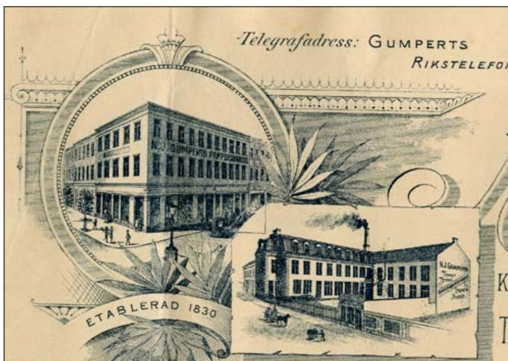
Gumperts bokhandel och fabrik 1903