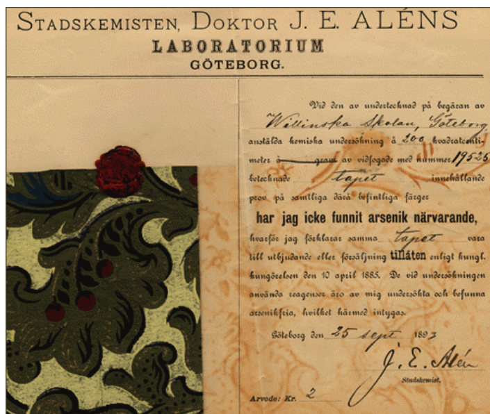
Bildtext: Tapetprov 1893 i Göteborgs hälsovårdsnämnds arkiv