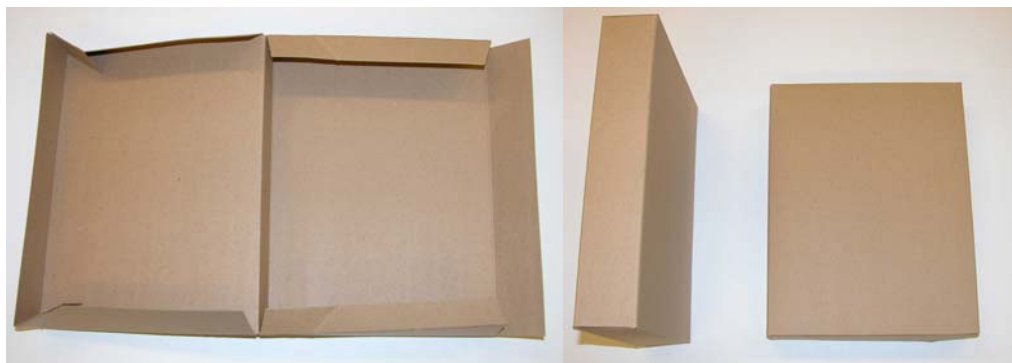
Bilden visar från vänster till höger: öpnad arkivbox, rygg och ovansida

Arkivboxar kan köpas från: Inköp på Regionens service (se Regionens hemsida), ABM-produkter www.abmprodukter.se eller Corporate Express www.tgskrivab.com .